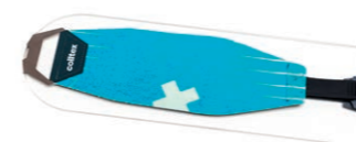
Plexi Tödi, Art.-Nr. 19000