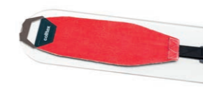
Plexi Lucendra, Art.-Nr. 18793