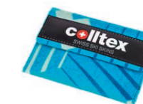
Portemonnaie, Art.-Nr. 8534